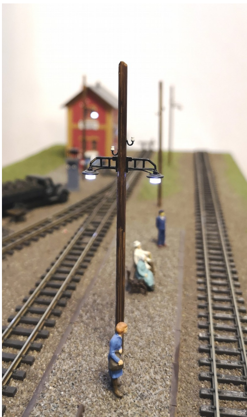
Art.-Nr. 20019 Bahnhofslampe Sayda einfache Ausführung Fertigmodell beleuchtet

Zur Erweiterung unseres Lampensortimentes fertigen wir die Schirmlampen mit den 2 Isolatoren in einfacher und doppelter Ausführung. Diese waren auf vielen Bahnhöfen aufgestellt. Die Lampen sind wie alle unsere Lampen mit LED's beleuchtet.