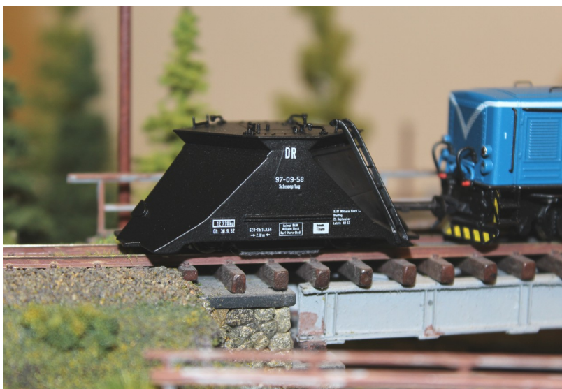
Bild zeigt H0e-Modell

Aufgrund der hohen Schneemenge in Sachsen wurden auf mehreren Strecken Schneepflüge angeschafft. Die Schneepflüge werden immer von der Lok mit hoher Geschwindigkeit geschoben. Oftmals wurden sie bei planmäßigen Zügen vorangestellt. Unser Modell entspricht dem Schneepflug der in Thum beheimatet war. Er wurde später auch in Schönheide eingesetzt. Er besitzt einen Reinigungseinsatz für die Gleise. Dieser kann aber zur Minimierung der Reibung entfernt werden.